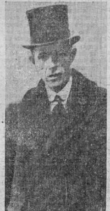
Lord Halifax ha sido designado para suceder al capitán Eden como ministro de Relaciones Exteriores de Inglaterra, siguiendo la dimisión del defensor de la Liga de las Naciones debido a diferencias de opinión con el jefe del gobierno.

Las competencias de futbol por el trofeo ESSO darán comienzo el domingo 27 del corriente mes. Los clubs presentarán a la Federación el plan económico para esas competencias. Del producto de los ingresos se apartará un porcentaje que se destinará para hacer frente a la deuda de quinientos dólares que contrajo el comité olímpico para hacer frente a los gastos de la embajada deportiva de Costa Rica que concurrió a las olimpiadas celebradas en Panamá.